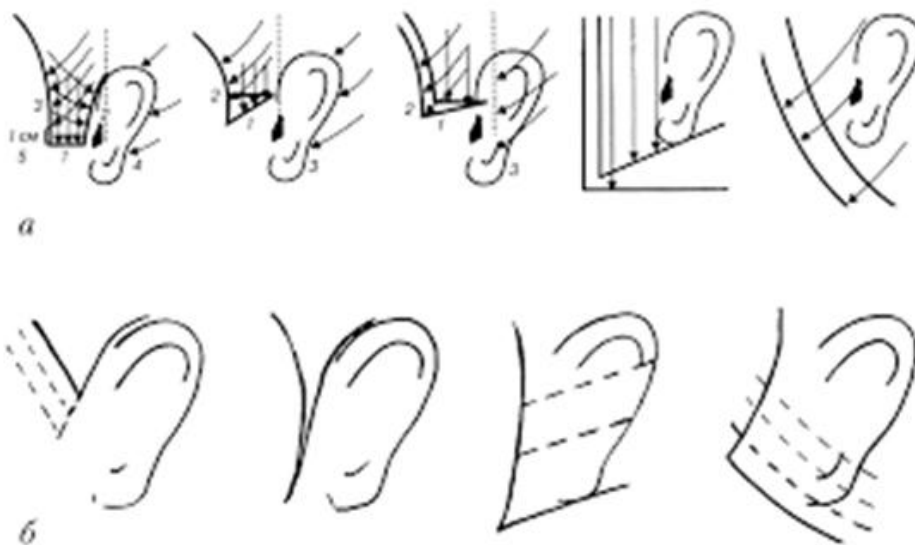
Рис. 2. Виды окантовки висков: а - мужских; б - женских